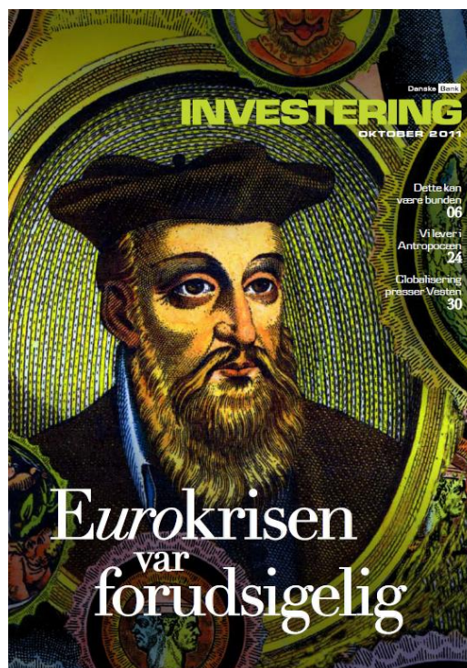
Danske Banks magasin Investering , oktober 2011