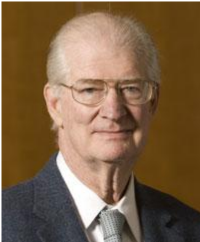
Herman E. Daly

Samme artikel beskriver den amerikanske økonom Herman Dalys model for en steady-state økonomi. Dvs. en økonomi med et befolkningstal og en mængde materielle goder, som kan opretholdes med så små strømme af energi og fysiske ressourcer, at økosystemernes bæredygtighed ikke trues.