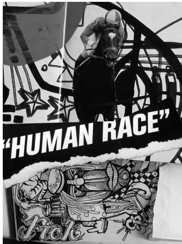
Illustration: Thomas Pålsson

Og alligevel er der en vis logik i galskaben, for sport har sådan set aldrig handlet om den spontane glæde ved kropslig leg eller udendørs aktivitet – tværtimod. Fra begyndelsen har det i stedet handlet om viljens kontrol over kroppen, altså bevidsthedens evne til at disciplinere kroppen til at efterstræbe mål, som egentlig er den ganske uvedkommende. Sport handler således ikke om at lege, slet og ret, men derimod om at vinde, hvilket er noget ganske andet.