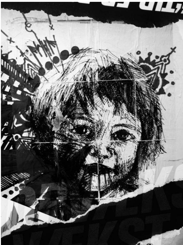
Illustration: Thomas Pålsson (fra bogen)

Man kan kalde de få timer fra afhentning i dag-institutionen til godnatputning om aftenen for kvalitets-tid, men de er ofte travle og uden plads til barnets behov, skriver forfatterne. Det er svært at være uenig i præmissen, men når sproget pludselig stikker af for forfatterne og der tales om ”at antallet af børn, der ankommer til institutionen fyldt med panodil, er stigende,” så trættes denne signatur, for fyldte er de vel ikke?