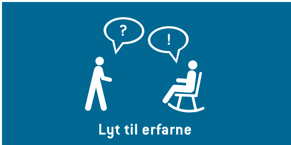
Figur 3. Vi skal inddrage mange slags erfaringer, ofte fra uvante kilder. Eksempelvis kan vi lære meget om bæredygtighed ved at lytte til vores ældre samfundsborgeres erfaringer fra tidligere tider.

Blandt de mere overordnede trin/elementer finder man f.eks. opfordringen til, at man skal ære de ældre, idet de er i besiddelse af en praktisk viden, som er vigtig for omstillingen til et lavenergiamfund. De ældre har – qua deres alder – på egen krop oplevet overgangen til billig-olie æraen, specielt perioden mellem 1930-1960. Af de ældre kan man derfor lære, hvordan man