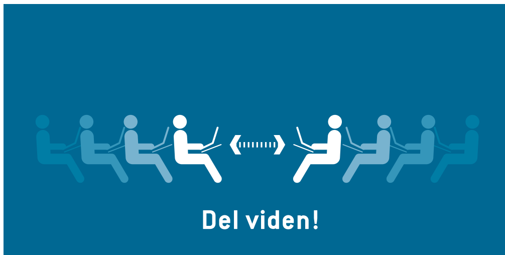
Figur 2. Omstillingsinitiativet fokuserer på vidensdeling, så de enkelte lokalgrupper kan støtte og inspirere hinanden.